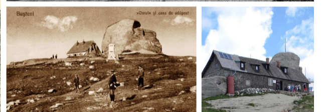
Az SKV sziklának épített kő menedékháza, mellette az első román menedékház. Alatta a román ház, jobbra a Mihai Haret nevét viselő menedékház, alatta a csúcs sziklája, az eget kémlelő emberfej, mellette a mai menedékház.