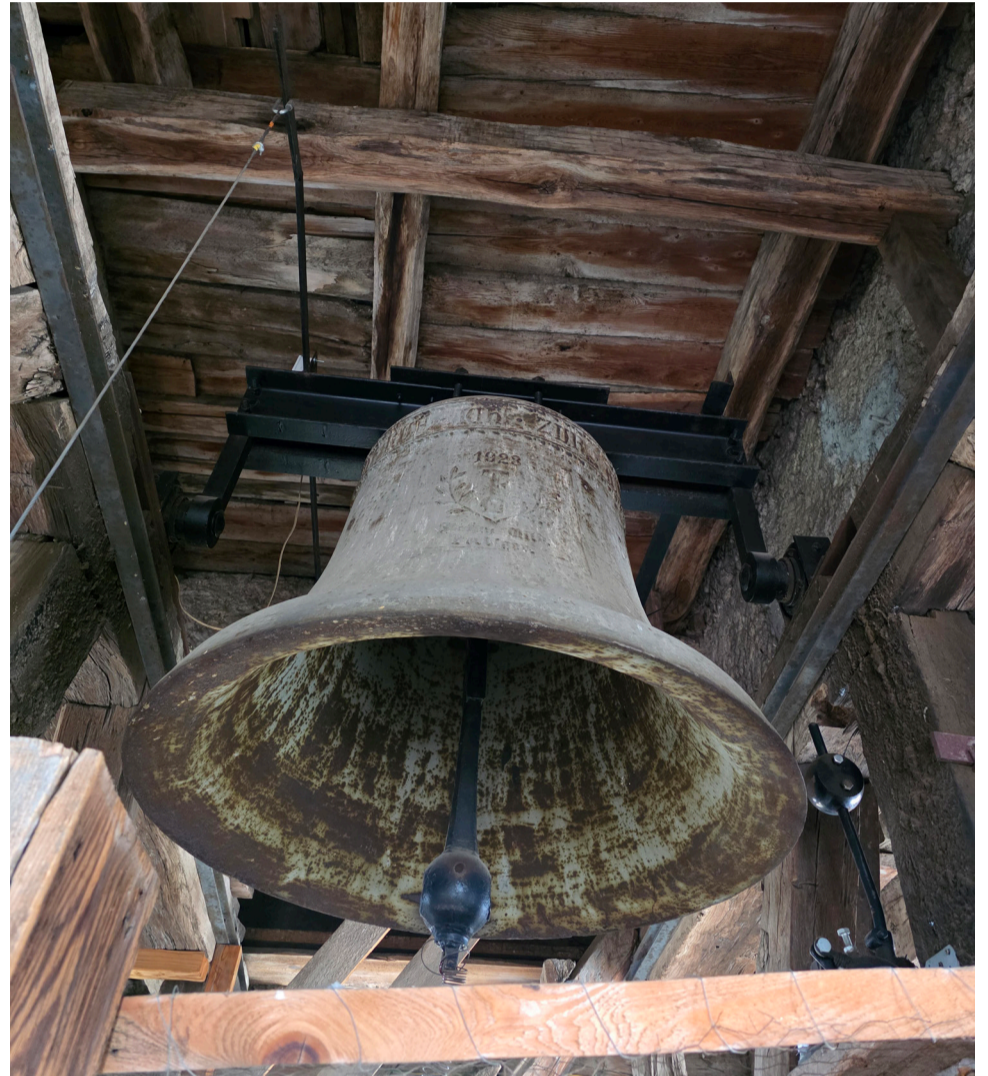
Szászhermány templomerdőjének harangja

Az angyalok fényességgel töltötték meg Betlehem mezejét, amikor megje-