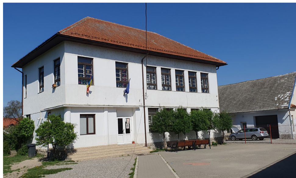
Hosszúfalusi evangélikus elemi iskola (1938–1948)