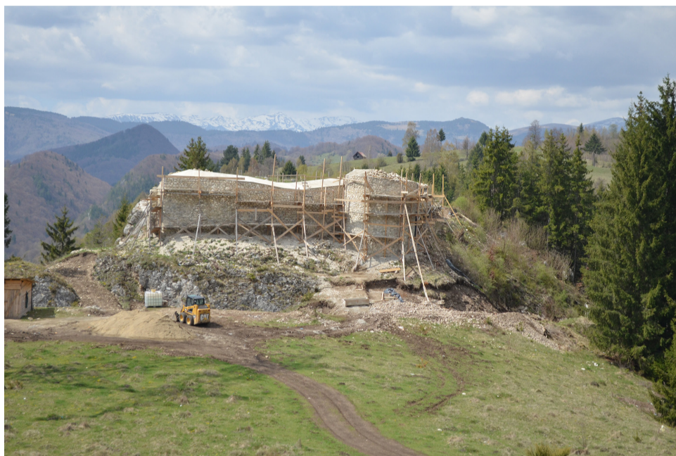
Felújítják Királykő várát

A Német Lovagrend délebbre is eljutott. A rend hódításaival a király a Dunáig terjesztette birtokát. Miután 1225-ben II. Endre kiűzte a Teuton Lovagrendet az országból, a délkeleti részek védelmét az Erdély hercegévé kinevezett trónörökös vette át. Béla herceg a Déli-Kárpátok, az Olt és a Duna közötti területeken létrehozta a Szörényi Bánságot, így szilárdította meg a magyar uralmat, 1226 körül pedig Milkó központtal missziós püspökséget alapított. Egyes történészek a Lovagrenddel hozzák kapcsolatba Argyasudvarhely ( Ardisis , Argen , Curtea de Argeș ) alapítását is, amely 1310 körül a Kárpátoktól délre fekvő kenézségeket egyesíteni próbáló Ivanko Bazarad fejedelem udvara volt. Az udvar az 1330-as magyar támadás során megsemmisült. 1381-ben Nagy Lajos király kérésére a pápa itt hozta létre az esztergomi érsek