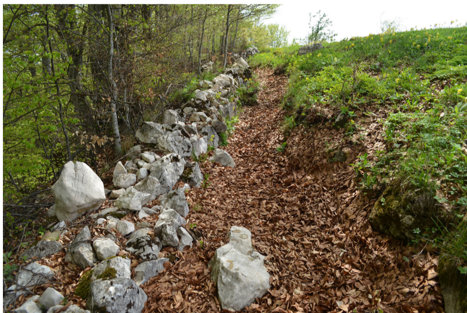
Első világháborús lövészárkok Ciocanu faluban

ségnek alárendelt Magyar-Oláhországi római-katolikus püspökséget.