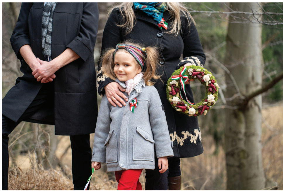
Március 15. Négyfaluban.

A különböző helyszíneken egy szó újból és újból felcsendült: szabadság . Mi a szabadság? – hangzott a kérdés dalban, imában, versben, szónoki beszédben. S miközben az 1849-es csata helyszínén, a tömösi emlékműnél emlékezett, a szabadságról vívott harcra beszélt a Brassó megyei magyarság, az országúton éppen egy sor harci jár-