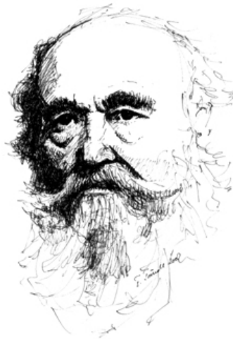
Istók János (1873–1972) – Négyfalu díszpolgára (Tomos Tünde rajza)

A születés beírásánál feltüntették, hogy a gyermek mikor született, törvényes, azaz házasságon belül történt-e vagy elismerte-e az apa, vagy nem történt meg az apai elismerés, feltüntették vallását, szülei nevét s ezek foglalkozását is.