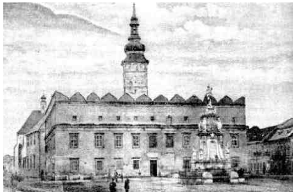
Az eperjesi (Felvidék) evangélikus kollégium